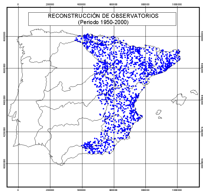
Figura 2: Distribución del total de observatorios pluviométricos (1249 estimados) susceptibles de ser reconstruidos en el periodo 1950-2000 (fuente INM, Madrid). Se muestra la distribución de la vertiente mediterránea, así como los de las fachadas de barlovento de las diferentes cuencas hidrográficas (Cantábrico, cabeceras del Duero, Tajo, etc).

En definitiva, dadas las numerosas combinaciones posibles, estos datos que se muestran en la tabla 2 son una mera visión general de las enormes posibilidades que ofrecen los fondos documentales del INM, un patrimonio científico de primera magnitud que nos proponemos explotar en toda su extensión. En la tabla 2 se incluyen las vertientes de barlovento de las cuencas que vierten al mediterráneo sus aguas, aunque queden fuera de sus límites.